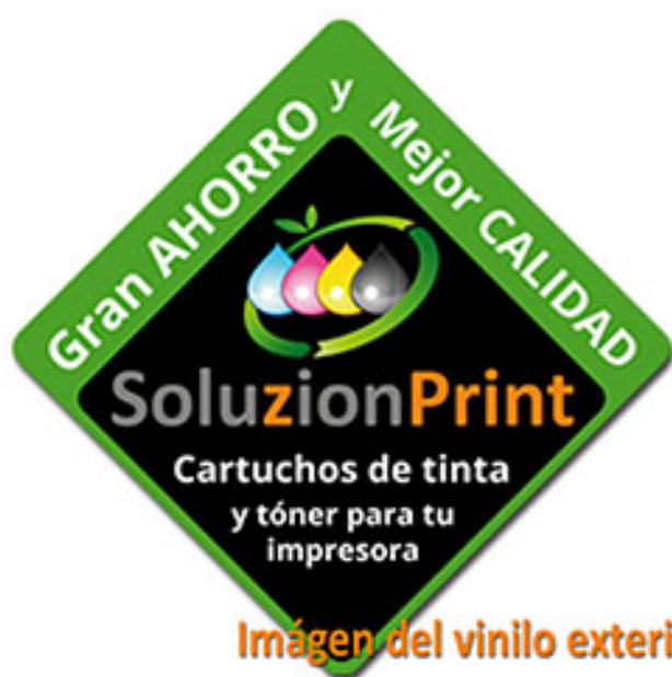
Imagen del vinilo exterior

También se han diseñado dípticos (10 x 21 cm), que se servirán en breve para poder tener en la tienda y que la gente los coja, y también, para poder enviarlos a las empresas dando a conocer este producto y las diferentes ofertas que podamos facilitarles al respecto.