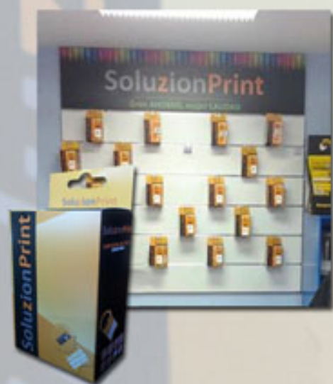
Imágen del mueble pequeño