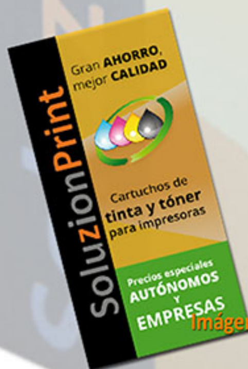
Imagen del díptico