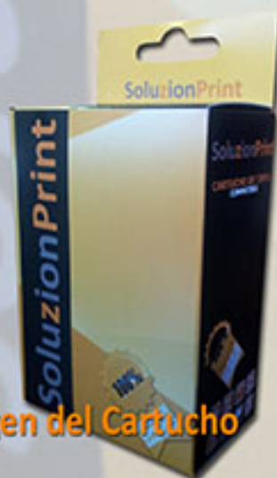
Imágen del Cartucho