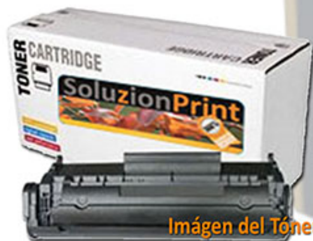
Imágen del Tóner

En el caso de los tóner, el producto viene en cajas de carton de alta resistencia, con precinto de seguridad exterior y protecciones de aire en formato interior. Identificada lógicamente como producto SoluzionPrint.